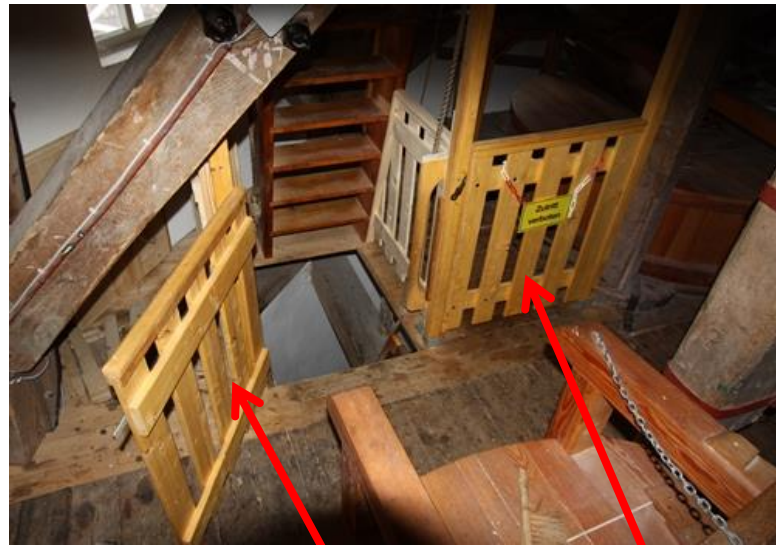
Absperrung Treppenloch Kappsöller